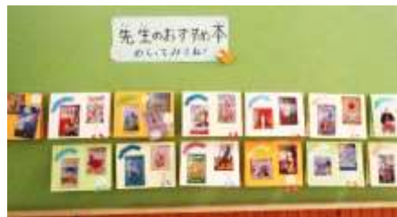
↑ 先生のおすすめ本

さて、11月の読書週間は、いつもよりたくさん本が読めましたか？読書スタンプラリーに参加してくれたみなさん、ありがとうございました。「うちどく」に参加されたお家の方からは「また企画してください」「子どもと一緒に学ぶことができました」というコメントもいただきました。冬休み中も、家族で「うちどく」をしてみてくださいね。