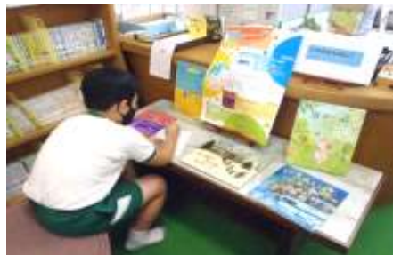
↑ ポップを書いています！